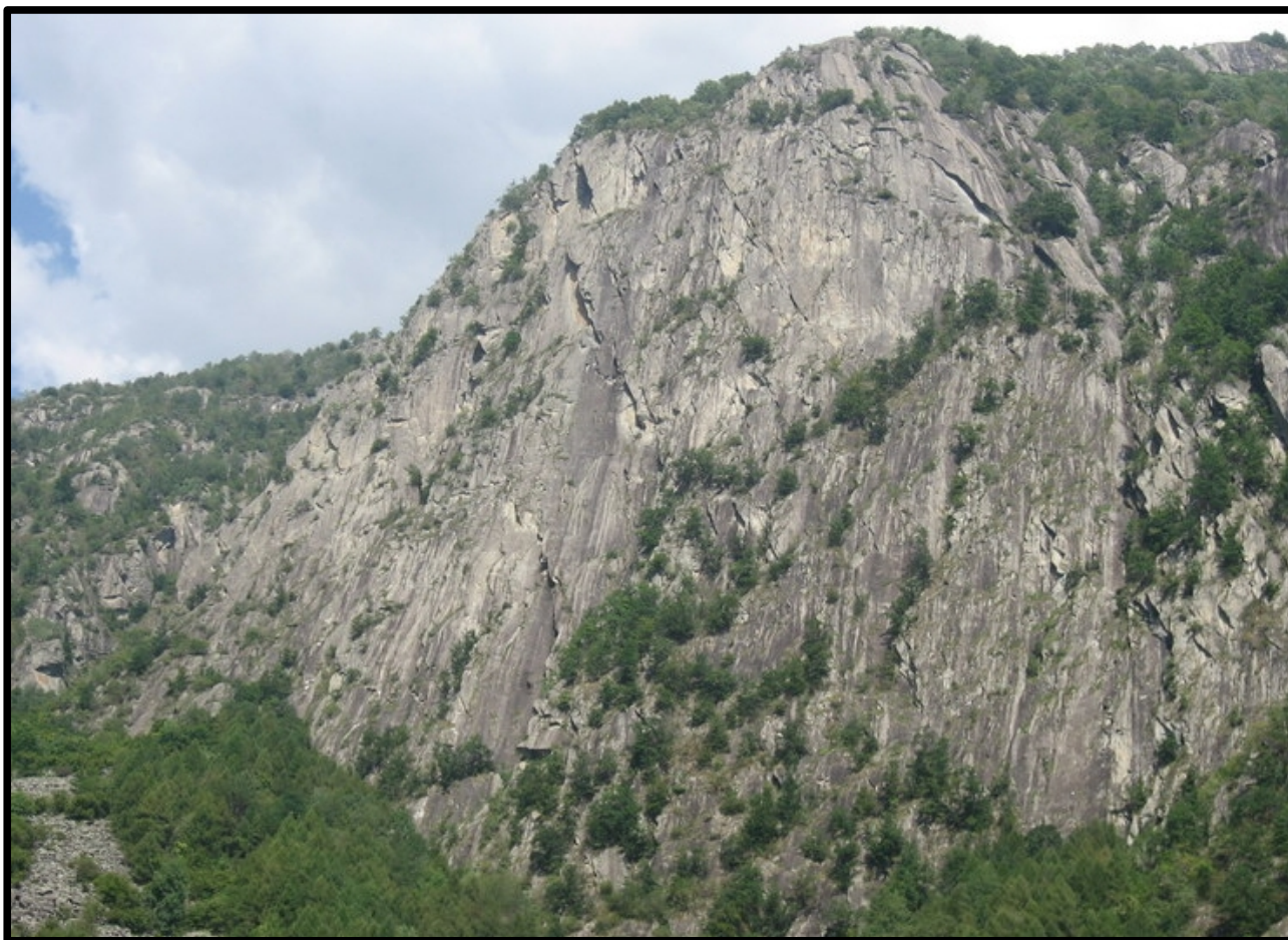
La bella parete del Pesgunfi .

Dall'imbocco della mulattiera, tenendo le spalle alla strada asfaltata, prendere la traccia in salita sulla sinistra che, brevemente, conduce alla parete (15min).